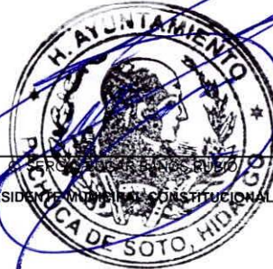
PRESIDENTE MUNICIPAL CONSTITUCIONAL